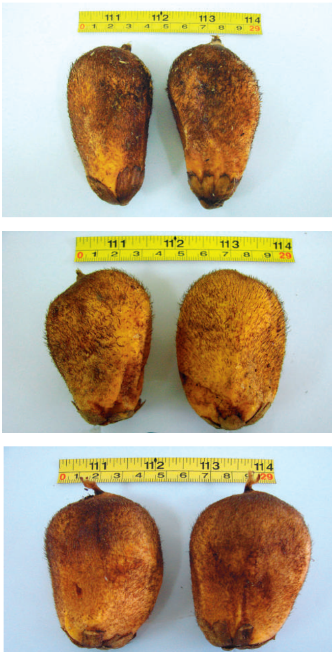
Figura 3. Variabilidade de formato e cor do fruto de murumuru.