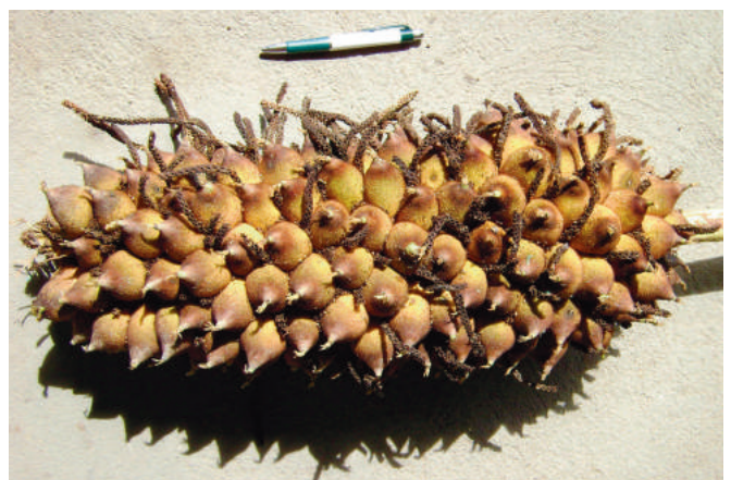
Figura 2. Detalhe da inflorescência e cacho de murumuru.