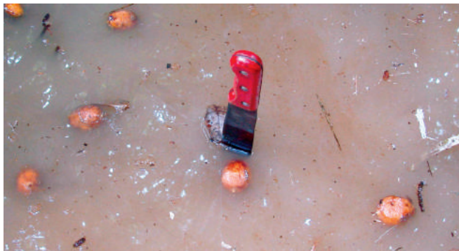
Figura 1. Frutos de murumuru e sua principal forma de dispersão.

longos espinhos pretos de até 12 cm de comprimento e a disposição dos frutos nos cachos, voltados para cima (SOUSA et al., 2004).