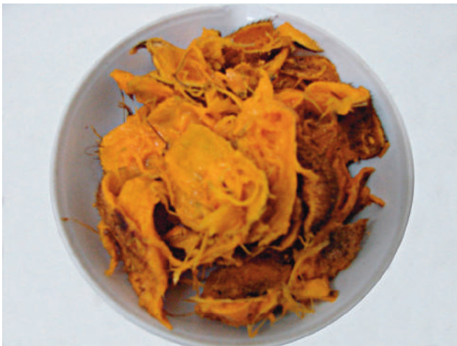
Figura 5. Detalhe da polpa (mesocarpo) no fruto de murumuruzeiro e após despulpamento.

O fruto de murumuru não pode ser considerado uma boa fonte de proteínas, pois o teor bruto encontrado na polpa está em torno de 4%.